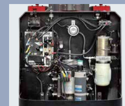
Capó con apertura completa, fácil acceso a todos los componentes y fácil mantenimiento.