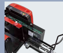
El cambio lateral de batería es una prestación de serie.