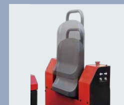
La altura del respaldo puede ajustarse dentro de un rango determinado, y el respaldo con apoyo para las caderas aumenta enormemente la comodidad del operario.